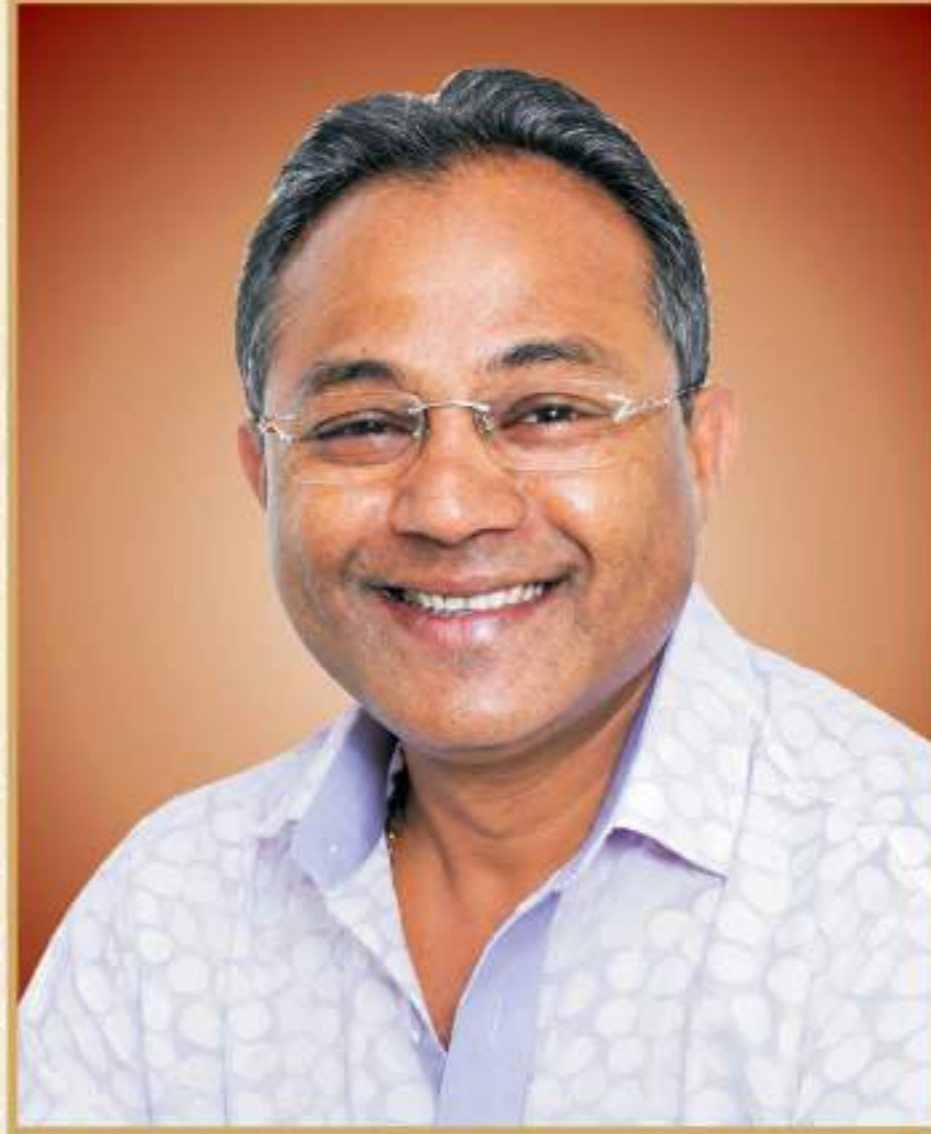
૬૨૬૭ નાની તુંબડી