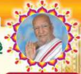
પ.પૂ.આ.ભ.શ્રી.વિ. પ્રેમસૂરીશ્વરજી મ.સા.

શ્રી મધ્ય મુંબઈના ભાગ્યવંતા માટુંગા નગરે